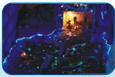
2nd Prize: St John's MSCC Singasandra