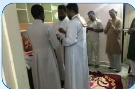
The Bapatla Mission, Andhra Pradesh