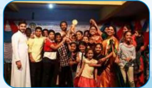
Mumbai District MCCL Kaloltsavam