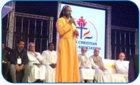
Christian Welfare Association Christmas Celebration, Thane