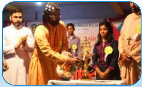
Sunday School Kalolsavam Mumbai District