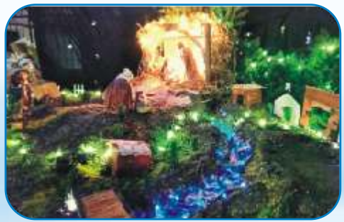
3rd Prize: St Anthony's MSCC Pune