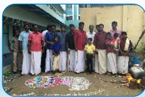
Pongal Festival, Ayyappakam - Chennai