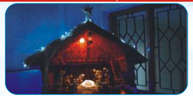
1st Prize: St Mary's MSCC, Hennur