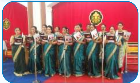
Mathru Sangham Get Together, Kharghar