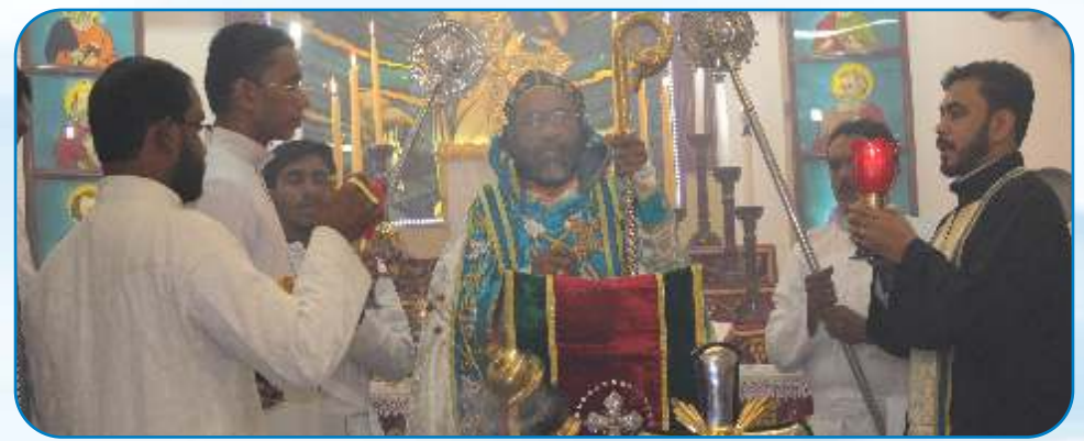
Holy Family Feast Day Celebration, Vikhroli