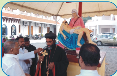
Blessing of the Pieta, Padi - Chennai