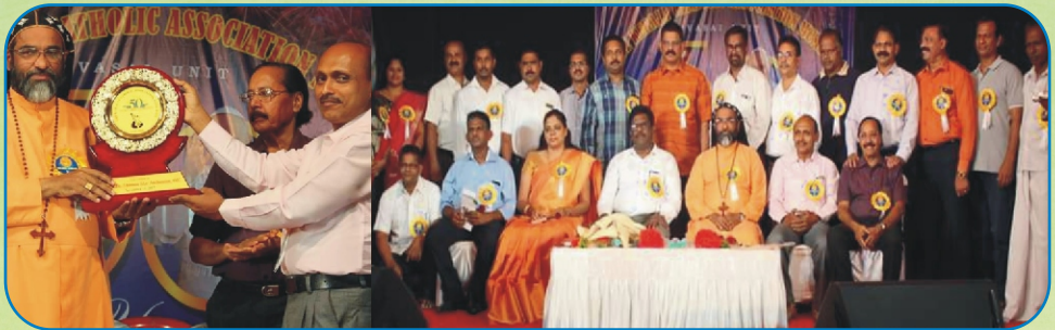
Kerala Catholic Association Golden Jubilee Celebrations, Vasai