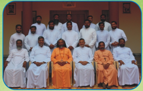
Aboon and the Priests during the Annual Retreat, Pune