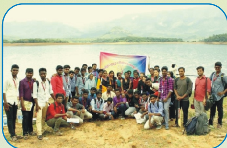
Mar Gregorios College Students at Rural Camp in Kanyakumari