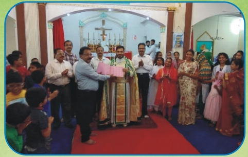
Inagation of Food Coupons for Fund Raising, Sakinaka