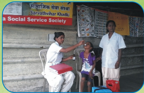
Children's Day & Vaccination Program, SEVA