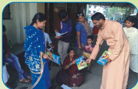
Aboon with the Gospel Preachers' and Literacy for the Illiterate, Warje