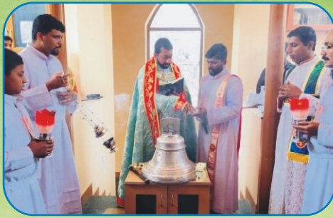
Blessing of the Church Bell, Chinchwad