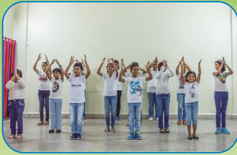
Family Day Celebrations, Khadki