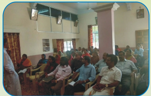
Suvisesha Sangham Formation, Jeedimetla