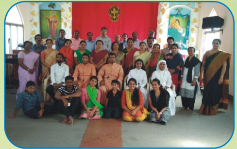
Mathrusangham Arts Festival, Chinchwad