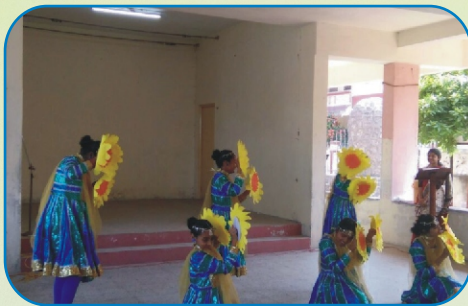
Parish Day Celebrations, Dehuroad and Kalewadi