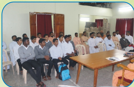
Minor Seminarians and the Priests Gathering, Khadki