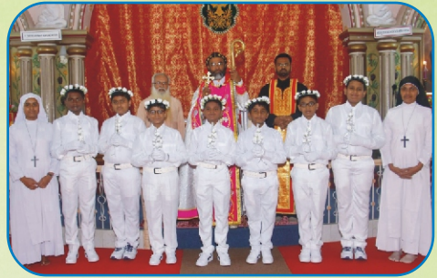
First Holy Communion, Kalewadi