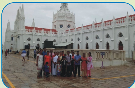
Parishioners from Goa at Velankanni Church