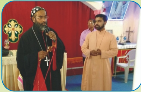
Aboon at the Vasai Parish