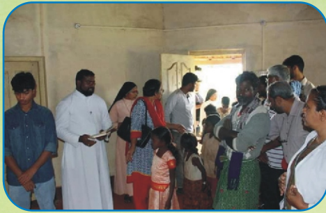
Medical Camp, Kamagiri