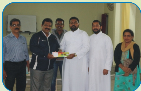
Inauguration of Lucky Draw Coupon, Pune