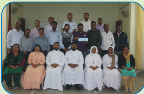
Pune District Pastoral Council Meet