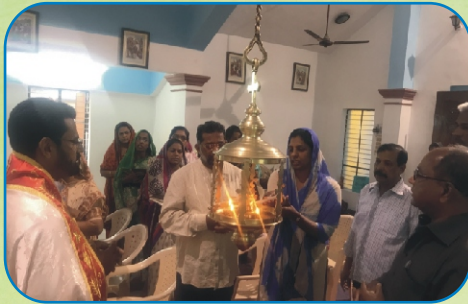
Inauguration of Parish Suviseshasangham, Dehuroad