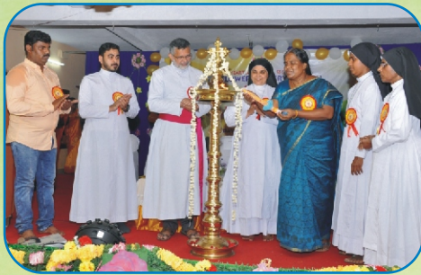
Annual Day Celebration of Little Flower Nursery, Padi - Chennai