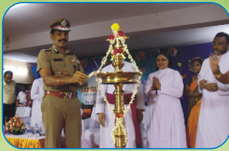
Annual Day Celebration - Sacred Heart School, Padi- Chennai