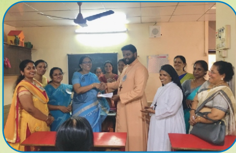
Srishti - Mumbai District Mathrusangham Literary Competition