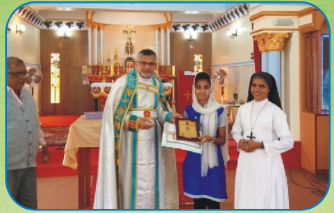
Kuwait MCA Award for the SSC topper from the Exarchate - Nasik