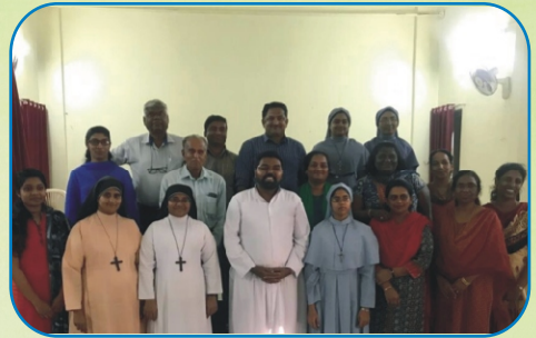
Pune District Catechism Teachers' Meet