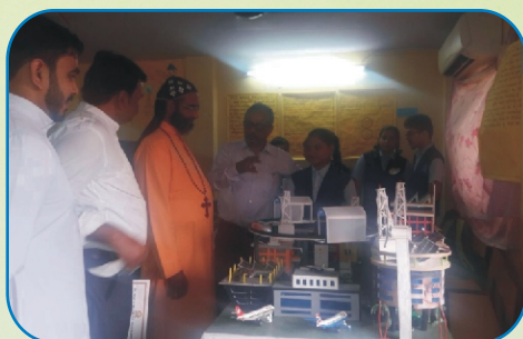
Aboon at Science Exhibition, Sakinaka