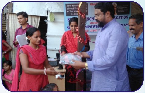
Distribution of Christmas Gifts