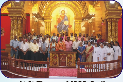
At St Thomas MSCC, Padi