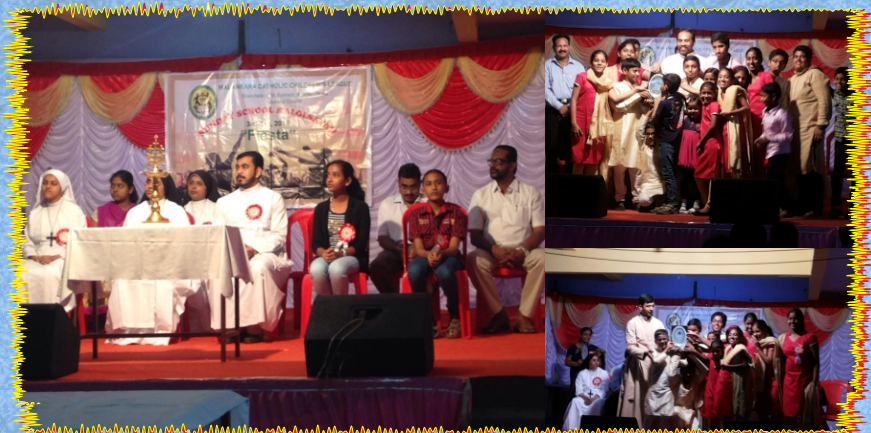
MCCL Kalolsavam, Mumbai District