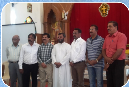
MCA Executive Committee Bangalore