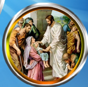
Cnaoitho Sunday - Miracle of curing the daughter of Cananite woman