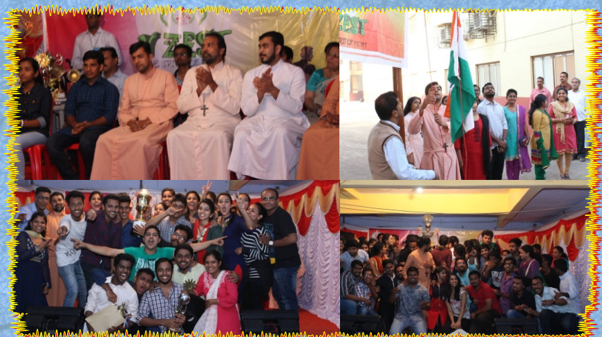
Y-ZEST, MCYM Mumbai District Arts Festival