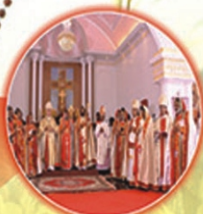
Inauguration of the Exarchate of Khadi-Pune