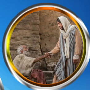
Garbo Sunday- Miracle of curing the leper