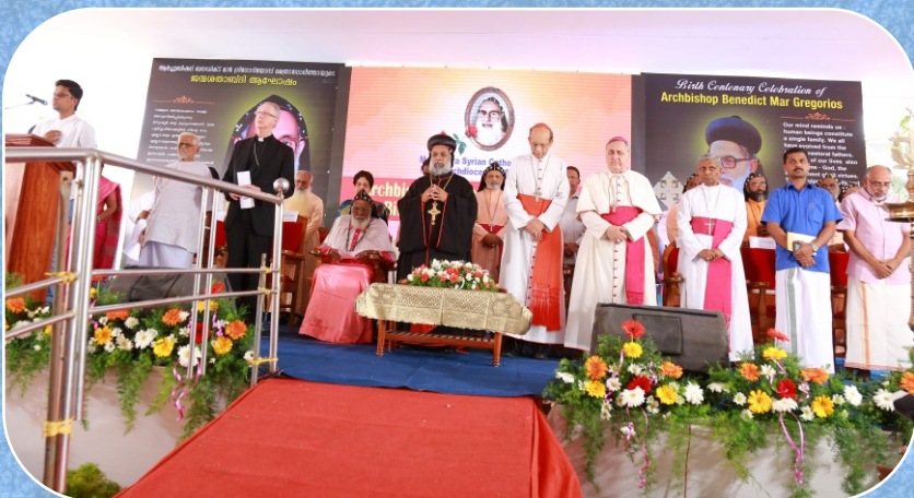
Birth Centenary Celebration of Archbishop Benedict Mar Gregorios