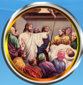
M'shario Sunday - Miracle of curing the paralytic

The six miracles performed by Jesus; meditated on the six Sundays of the Great Lent according to the Syro-Malankara Catholic Liturgy