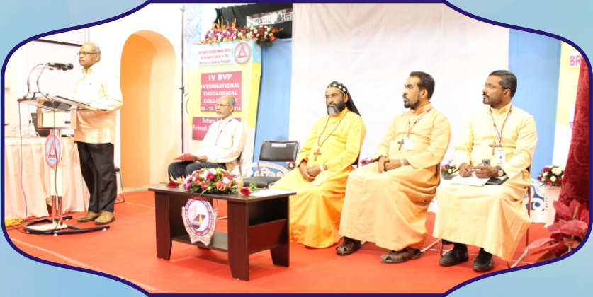
The Exarch inaugurates the International Colloquium at Bethany Vedavijnana Peeth, Pune