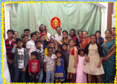
The Exarch with the Catechism Students at Sakhinaka Parish