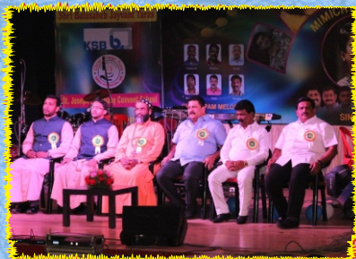
Musical Night organized by Dehu Road & Warje Malwadi Parishes in Pune