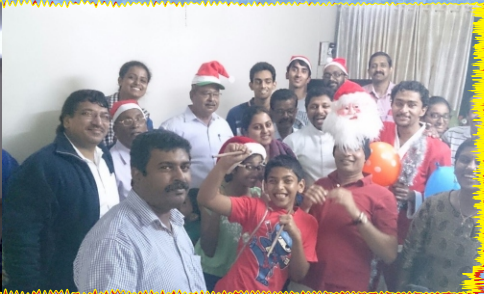
Christmas Celebration at St. Mary's Malankara Catholic Cathedral Church, Khadki