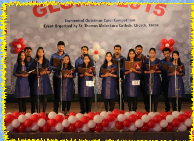
Ulhasnagar Parish at Gloria 2015 Carols Competition