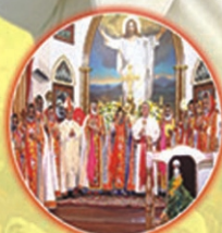
Inauguration of the Eparchy of Gurgaon