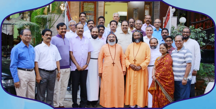
Inauguration of Saanthwanam - a Centre for Cancer Patients in Mumbai