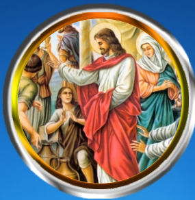
Kothine Sunday - Miracle of changing water into wine