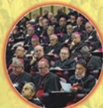
Synod on Family at Rome