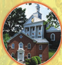
New Eparchy of USA & Canada