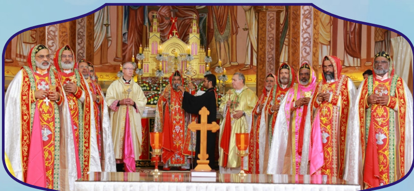
Birth Centenary celebration of Archbishop Benedict Mar Gregorios at Pattam Cathedral, Tivandrum