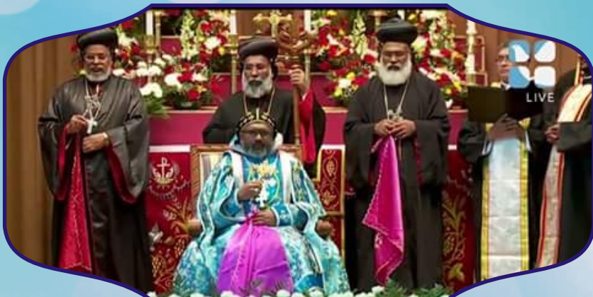
The first bishop of the Syro Malankara Eparchy of St. Mary, Queen of Peace of the United States and Canada