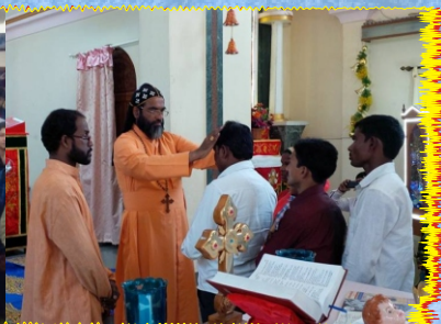
Christmas Celebration at St Mary's Malankara Catholic Church, Warje Malwadi