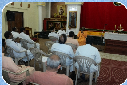
Ecumenical Meet at Bishop's House, Khadki