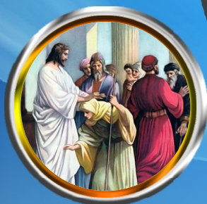
K'piphtho Sunday - Miracle of curing the crippled woman