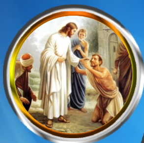
Samio Sunday - Miracle of curing the Blind