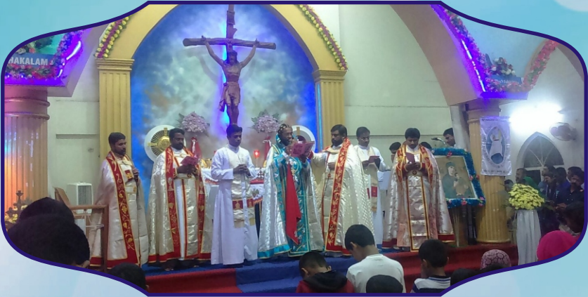
Bishop celebrates Holy Qurbono at Syro Malabar Church, Panvel