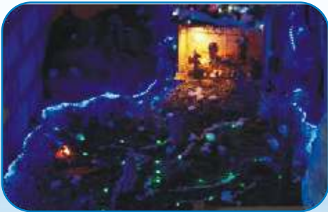
2nd Prize: St John's MSCC Singasandra