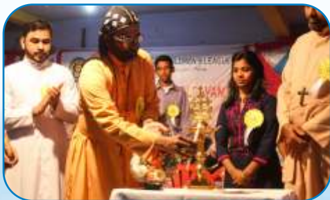
Sunday School Kalolsavam Mumbai District