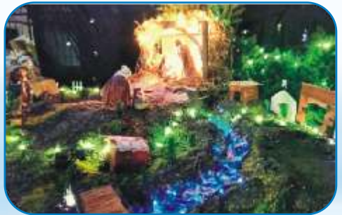
3rd Prize: St Anthony's MSCC Pune