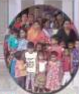
St Ephrem Vikas Ayojan, Pune