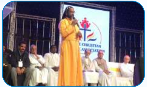
Christian Welfare Association Christmas Celebration, Thane