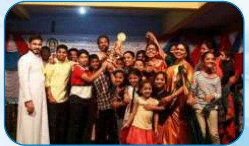
Mumbai District MCCL Kaloltsavam