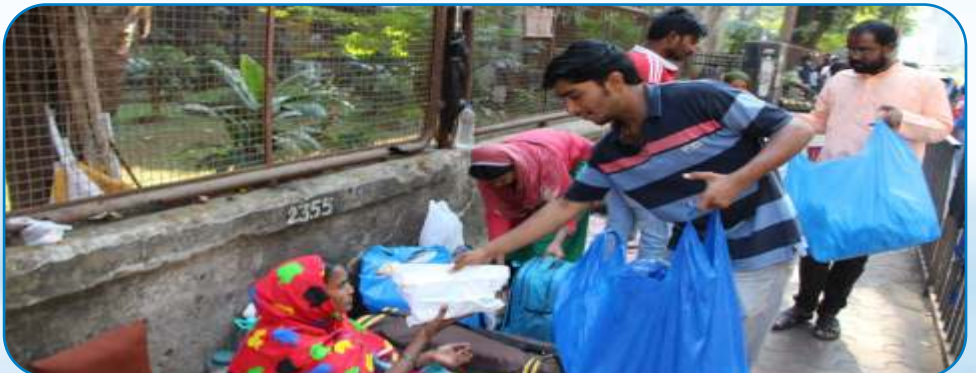
Food Distribution by Vikroli Parish