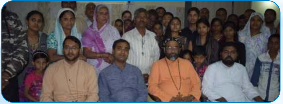
Inauguration of Marathi Mission, Warje Malwadi