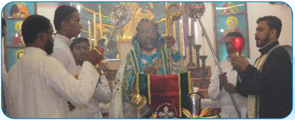
Holy Family Feast Day Celebration, Vikhroli