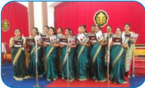
Mathru Sangham Get Together, Kharghar