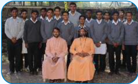
Bishop with the Minor Seminaries