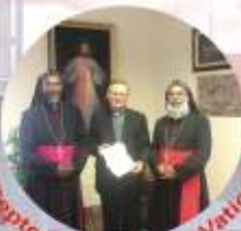
18 September 2016, at Vatican