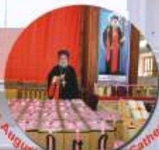
25 August 2016, at Patton Cathedral