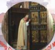
Closing Ceremony of the Year Of Mercy