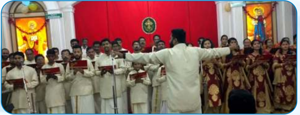
Christmas Carols Competition, Thane