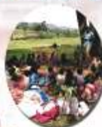
Educating village children in Kamagiri, Chennai