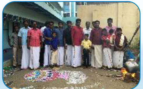
Pongal Festival, Ayyappakam - Chennai