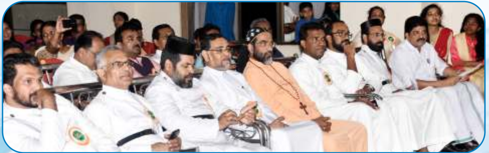
Christmas Celebration - Kalyan Ecumenical Association, Mumbai