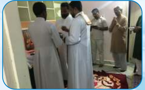
The Bapatla Mission, Andhra Pradesh