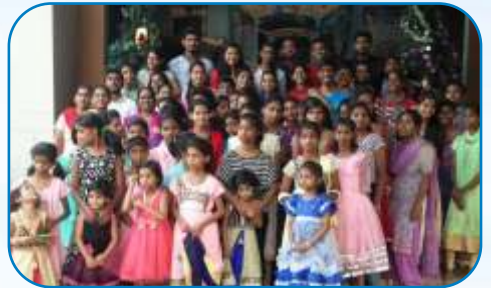
Thane MCYM with Balniketan Children