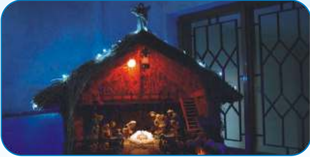
1st Prize: St Mary's MSCC, Hennur